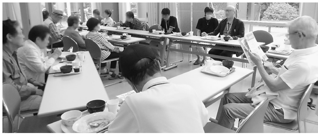
診療所と支部が地域のつながりづくりに貢献