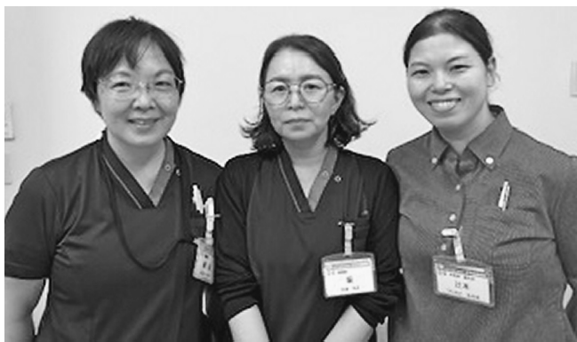
外来担当の看護師(中央が筆者)

そして低年齢の子どもはマスクの着用が困難で、さまざまな場所を触った手で口や鼻を触るため、感染予防がとて難しいです。病院での感染リスクを少しでも減らすために、一人ひとりの診察後にドアノブや椅子・ペンライトなどを拭き消毒して、安心な環境を提供できるように努力しています。