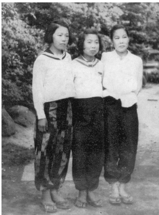
女学校(現在の中学校)2年の同級生と筆者(中央)「下駄履きとモンペ姿が懐かしい」と振り返る1946年6月撮影

持ち、長期化するリスクの高い高齢者のみを対象とする制度は、リスク分散という医療保険の原理では成り立たないという批判があります。機械的に75歳で区切ることや保険料を年金から差し引くことへの批判もあります。みんなにくらしを支えようという年金の趣旨に反すると▼さらに問題なのは「見直し」の説明に「現役世代の保険料と高齢者の保険料の上がる率を同じくする」としていることです。