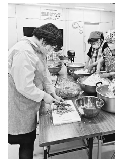
代表の職員が大量の野菜を慎重に切り準備

L(レズビアン)、G(ゲイ)、B(バイセクシャル)は性的指向(好きな対象)を表します。T(トランスジェンダー)は出生時に割り当てられた性別と自分が感じる性別が一致しない、という性自認(心の性)を表します。