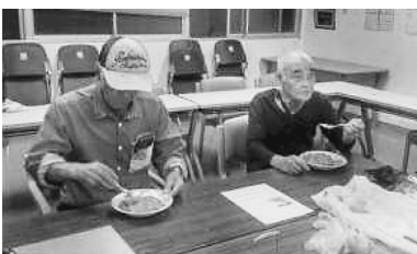
集会で紹介された「男の料理班」(奄美医療生協)

7月12日~13日、日本医療福祉生活協同組合連合会の「いのちの章典」実践交流会とともに生きる一人ひとりのものがたり」が開催されました。東京ほくとからは21人の組合員・職員が参加しました。 4か所の視聴会場のうち、私は生協北診療所講義室で参加しました。みんなと一緒に納得したり・笑ったりしながら、組合員の心得を学びたかったのです。 1991年に策定された「医療生協の患者の権利章典」に始まって、2013年策定の「医療福祉生協のいのちの章典」。策定から10年が経ち「新型コロナウイルス感染症の世界的パンデミック」「国際平和の危機」「気候危機の進行」「貧困と格差の拡大」「超高齢化社会」など、この間の社会情勢の変化が顕著だったと実行委員長から基調報告がありました。