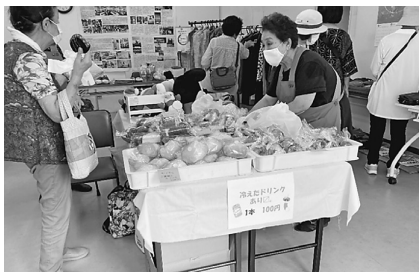
新品のドレスなど珍しいものも並んだ